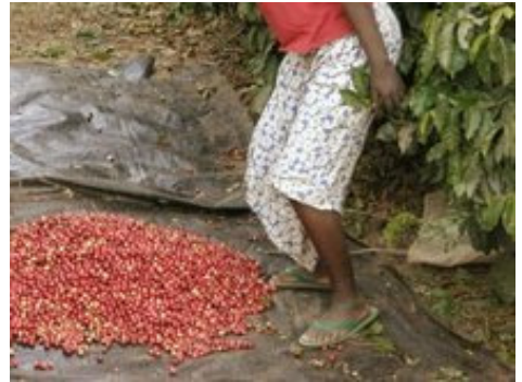
Caterpillar 2 (owero Ilrialice)