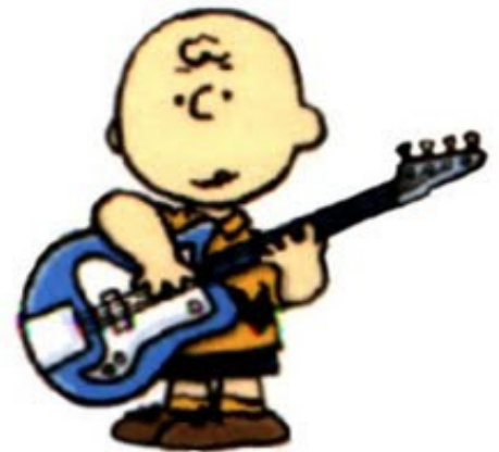
Caterpillar 3 (owero Daniele)